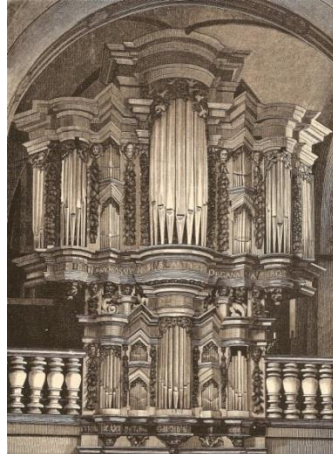
Stich der Orgel (vor 1881)

Das Pfeifenmaterial im Hauptwerk ist trotz einiger stimmtechnischer Veränderungen im Laufe der Jahrhunderte noch zu beachtlichen Teilen original erhalten geblieben, im Rückpositiv enthalten noch mindestens zwei Register Pfeifen aus dem 18. Jahrhundert. Selbst im 1960-62 neu konzipierten Pedalwerk scheinen nach jüngsten Erkenntnissen in Teilen ältere Pfeifen verwendet worden zu sein. Ob diese aus anderen Orgeln stammen oder durch Umstellungen innerhalb der Rhyneraner Orgel ihren neuen Platz gefunden haben, ist derzeit noch offen. Insgesamt gehört die Clausing-Orgel damit zu den wertvollsten historischen Instrumenten unserer Region, auch wenn der aktuelle Klang sicherlich noch weit von der Brillanz des ursprünglichen Klangbildes entfernt ist. Dazu kommen aktuell leider beträchtliche Schäden, u.a. am Pfeifenwerk. Die anstehende Restaurierung soll daher den wertvollen historischen Bestand konservieren sowie denkmalpflegerisch adäquat ergänzen, so dass dieses wertvolle klangliche Denkmal wieder in seiner ursprünglichen Klanglichkeit erstrahlen kann und somit auch für nachfolgende Generationen erhalten bleibt.