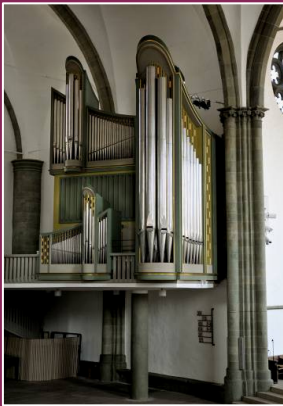
Pauluskirche: Beckerath 1967, III/39