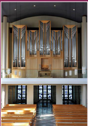
Liebfrauenkirche: Goll 2006, III/52

Musik als Klangrede – die wie eine Rede spontan entstehen kann – ist eine tragende Idee für die Musikpraxis, die erst im 19. Jahrhundert zugunsten einer genau formulierten und ausgewogenen Konzeption weicht. Die bis weit ins 18. Jahrhundert und darüber heute auch noch in Pop, Rock und Jazz anzutreffende ad-hoc-Spielpraxis trat damit immer mehr in den Hintergrund.