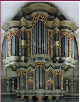
St. Regina: Reinking 1722, II/20